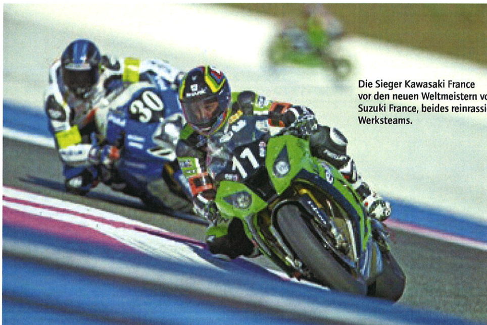
Die Sieger Kawasaki France vor den neuen Weltmeistern von Suzuki France, beides reinrassige Werksteams.

1,8 km ist die Mistralgerade lang, das heisst 22 s Vollgas, Runde um Runde – 24 Stunden lang. Dass so was aufs Material geht, ist klar, und so sahen nur 35 von 55 Teams die Zielflagge. Es gibt beim Circuit Paul Ricard keine Kiesbetten, sondern nur eingefärbte asphaltierte Auslaufzonen, und deshalb rutschen gestürzte Motorräder mit hoher